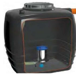
VASCA GIA' PRESENTE

GRIGLIA DI RACCOLTA (PIU' GRANDE E' LA DIMENSIONE DI QUASTA GRIGLIA DI RACCOLTA E MEGLIO INIZIA IL PROCESSO DI DEPURAZIONE)