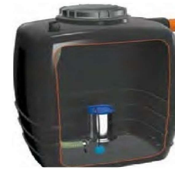
VASCA DI ACCUMULO

Le immagini sono unicamente a scopo illustrativo, e potrebbero non rappresentare il prodotto finale.